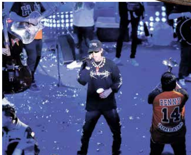
JUAN OLIVAS / EXPRESO